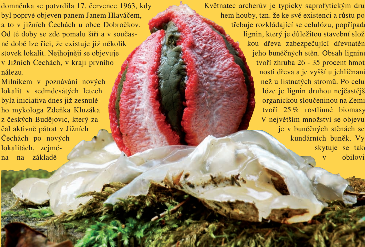
Květnatec krátce po prasknutí vajíčka; foto: Ivan Godál

Květnatec archerův je typicky saprofytickým druhem houby, tzn. že ke své existenci a růstu potřebuje rozkládající se celulózu, popřípadě lignin, který je důležitou stavební složkou dřeva zabezpečující dřevnatění jeho buněčných stěn. Obsah ligninu tvoří zhruba 26 - 35 procent hmotnosti dřeva a je vyšší u jehličnanů než u listnatých stromů. Po celulóze je lignin druhou nejčastější organickou sloučeninou na Zemi, tvoří 25 % rostlinné biomasy. V největším množství se objevuje v buněčných stěnách sekundárních buněk. Vyskytuje se také v obilovi-