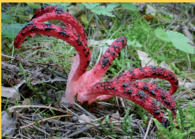
Plně rozvinutý květnatec archerův se sedmi rameny; foto: Vladimír Kunca