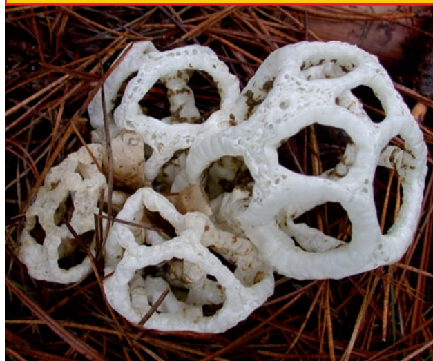
Ileodictyon cibarium autor; foto:

listopadu. Lokality představují širokou škálu biotopů, o kterých jsem se již zmiňoval. Poměrně hojně se začíná např. objevovat v různých parcích, soukromých zahradách, vyrůstá na mulčovací kůře apod. Na jedné lokalitě se může vzácně objevit i několik desítek či stovek plodnic, což lze vidět na fotografii v tomto článku.