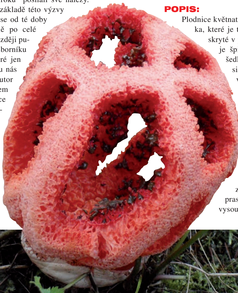
Mřížovka červená – Clathrus ruber P. Micheli ex Pers.; foto:

Plodnice květnatce vyrůstá z vajíčka, které je téměř do poloviny skryté v půdě. Jeho povrch je špinavě bílý až nažloutlý. Na řezu je vidět silná slizovitá vrstva, pod níž je teprve kryt zárodek plodnice, ten má v tomto stádiu zelenou barvu. Po protržení obalu vyrůstá plodnice hvězdicovitého tvaru - vrcholek vajíčka se začne zahrocovat, pak praskne a z něho se vysouvá 5-8 laloků při-