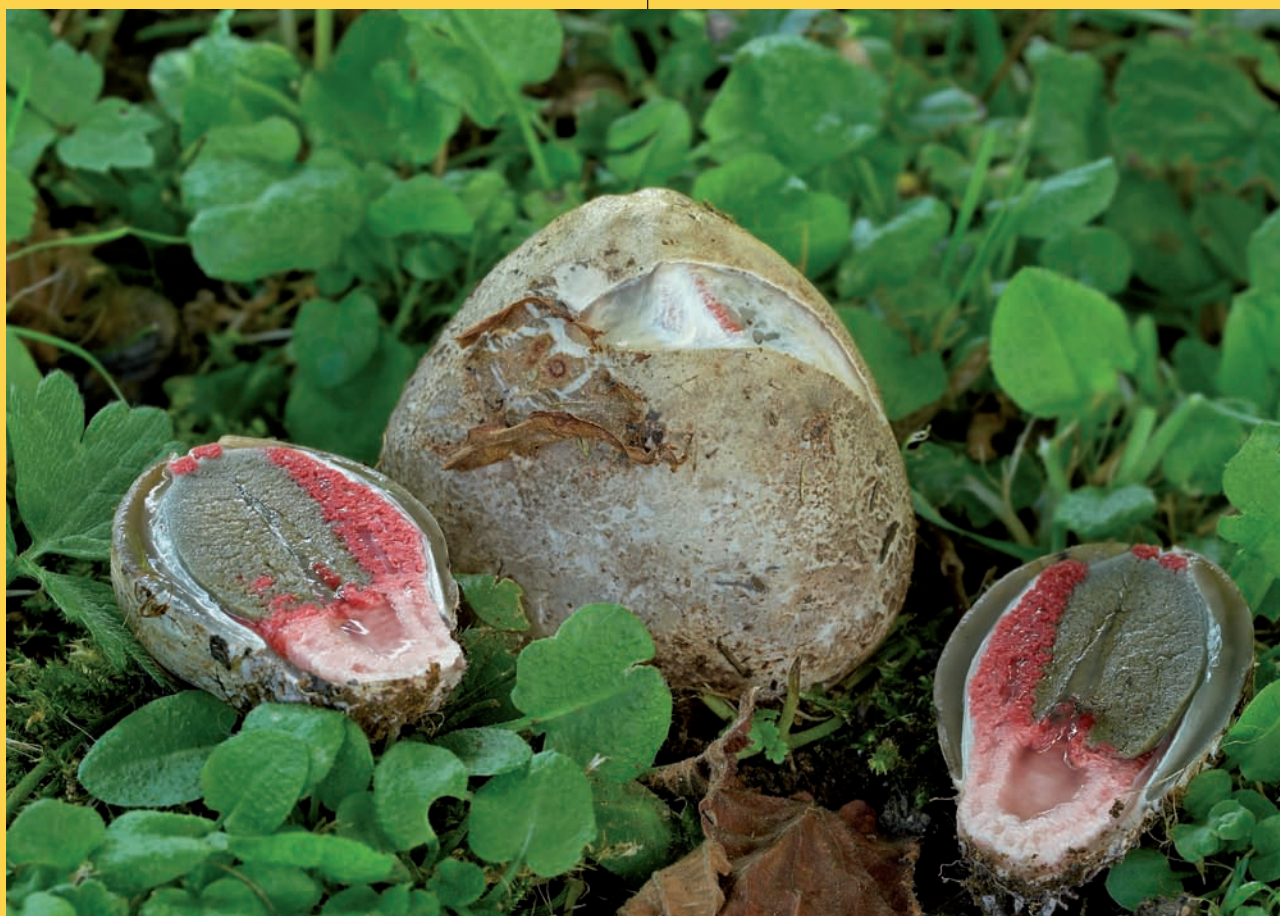
Vajíčko květnatce spolu s dalším v podélném průřezu; foto: Jaroslav Malý

vlastně vyústil ve splnění snu. Ale nyní již k samotnému květnatci. Květnatec archerův, Clathrus archeri , (Berk. 1860) Drink 1890 je břichatkovitá houba patřící do čeledi mřížovkovitých ( Clathraceae ), do které patří mnoho rodů a druhů, které rostou zejména v tropických oblastech. Některé z nich jsme zařadili do tohoto článku, abychom poukázali na rozmanitost této skupiny. Domovem této houby jsou tropické a subtropické oblasti, prvně byla popsána v jižní Tasmánii, vyskytuje se v Austrálii, na Novém Zélandě, na Jávě a v jižní Africe.