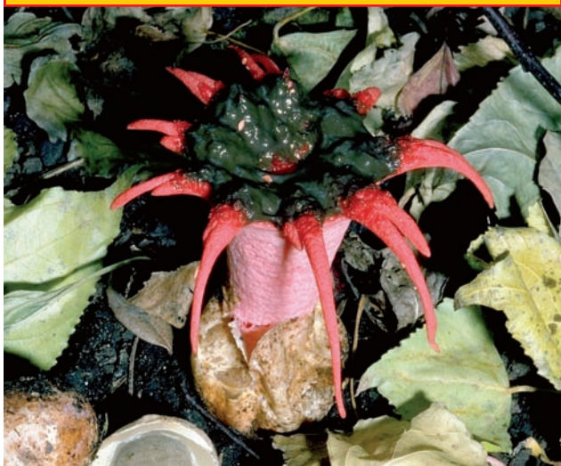
Aseroe rubra Labill. (1800)