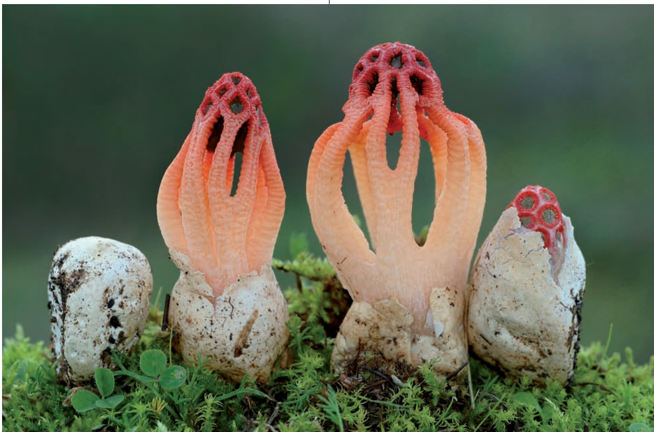
Colus hirsutus Cavalier & Séchier, 1935; foto: Carlos Tovar Breña

února, ale také v jiném ročním období, pokud je dostatečně vlhko. Vyskytuje se rovněž na mnoha středomořských ostrovech. Plodnice je zpočátku kulovitá, bílá, z poloviny ukryta pod zemí, na vnější straně s širokou vtisknutou síťovitou kresbou, má rosolovitý obal. Během dozrávání vajíčko praskne a objeví se mřížkovitý útvar s velkými oky, nesoucí na vnitřní straně ramen olivově hnědou výtrusorodou