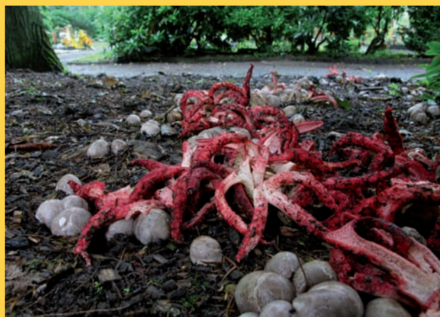
Květnatec archerův vyrůstá za příhodných podmínek i vmnoha desítkách plodnic

Při psaní tohoto článku o květnatci jsem prožíval jistou nostalgii, neboť právě tato exotická nevšední houba mne vlastně přivedla k houbám. V roce 1990 jsem byl na prvním nekomunistickém táboře v okolí zříceniny Přimdy (u města Aše), kde tento vzácný druh rostl přímo v areálu tábořiště. Čirou náhodou jsem měl s sebou malý kapesní atlas hub, v němž tato houba byla zobrazena a tak jsem tam všem členům tábora o houbě povídal - kde původně roste, jak se k nám dostala apod. Můj zájem o houby od této doby stále roste a vydáváním časopisu Svět hub