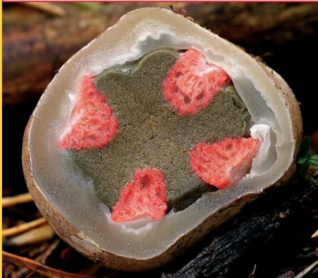
Příčný průřez vajíčkem květnatce